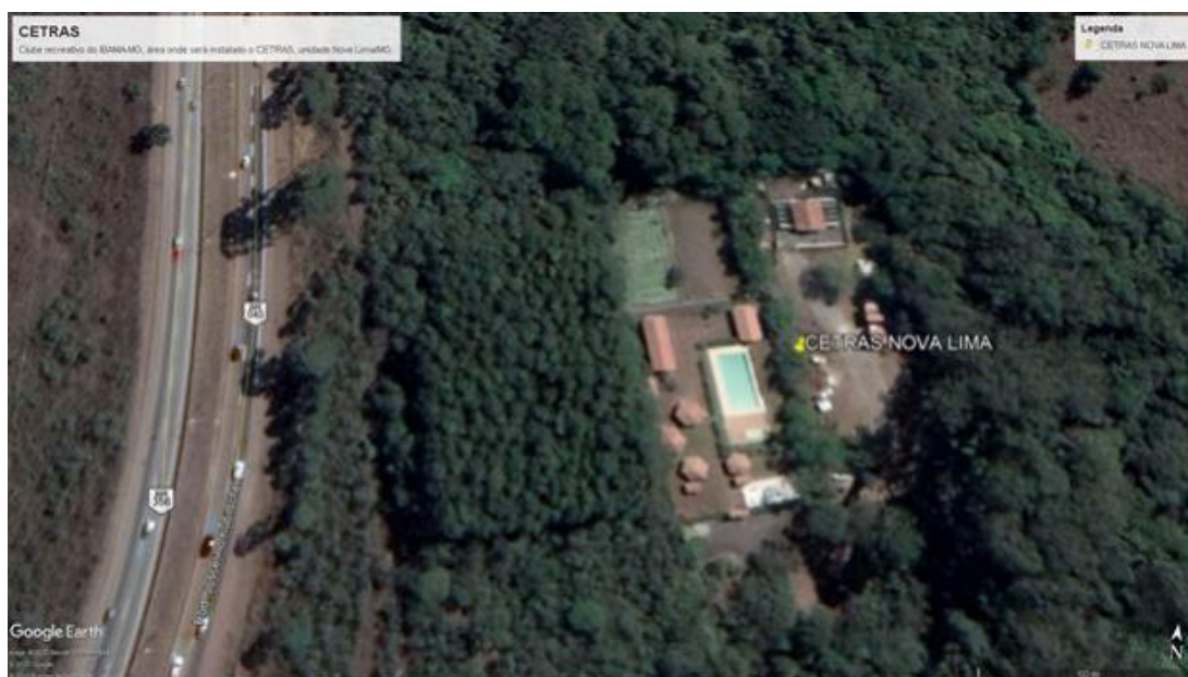
Figura 5: Área onde será instalado o Cetas (Latitude: 20° 8'44.31\"S Longitude: 43°57'28.56\"O).

De acordo com as informações aqui prestadas, a empresa contratada deverá realizar a adequação e complementação dos projetos de arquitetura e engenharia existentes (Anexo I).