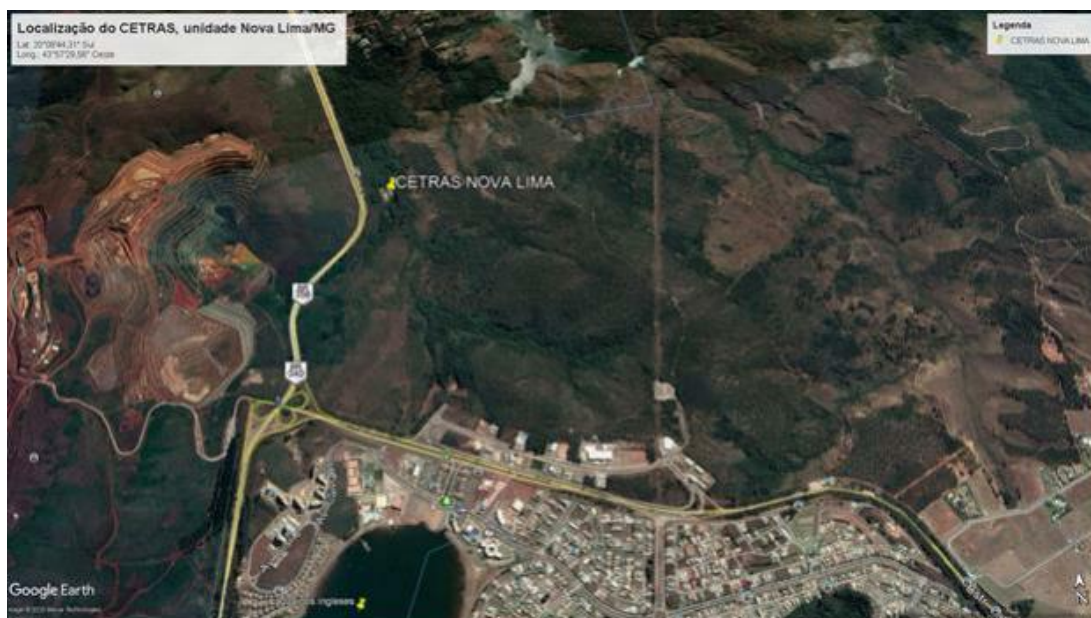
Figura 4: Identificação dos acessos ao Cetas.